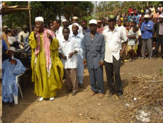
Les jeunes de Farmoriah à l'arrière plan