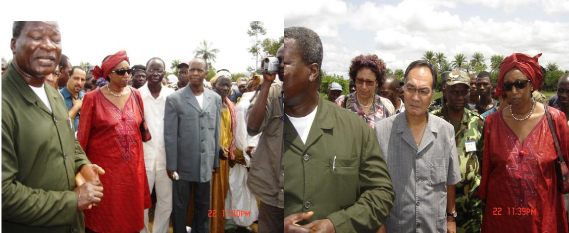
La délégation à leur arrivée à Pamelap pour les cérémonies de remise

District de Modia, CRD Farmoriah (bénéficiaire d'une école de trois classes qui remplace trois paillotes).