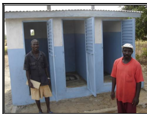
Latrine et poste de santé de Mabala lors de la réception technique du 05/04/06