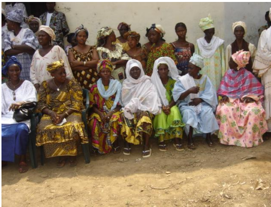
Les femmes de Farmoriah