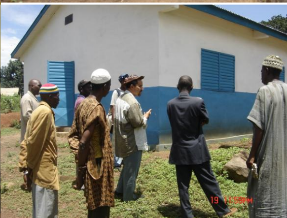
Les Chargés de Programmes du PNUD accompagnent le projet sur le terrain