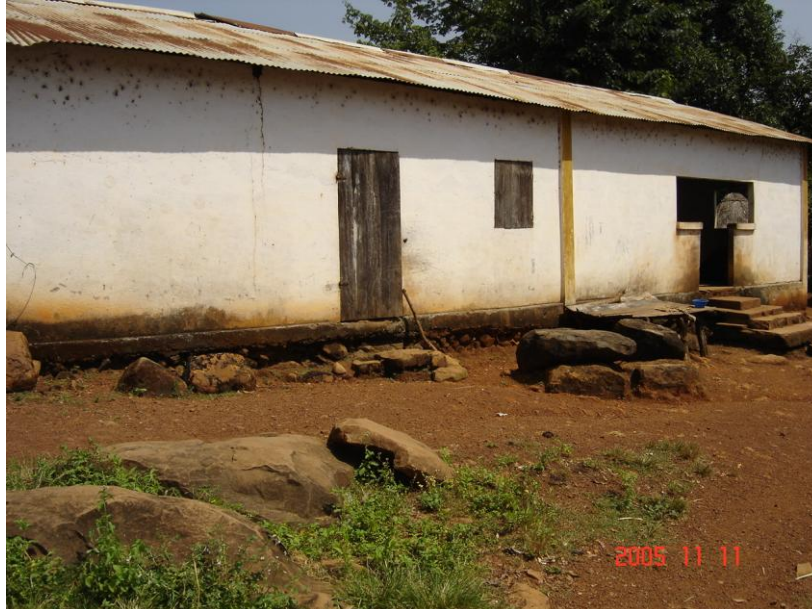
Vue d'ensemble du poste de santé de Kolakhouré :