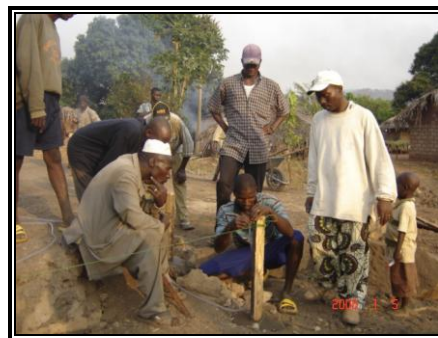
Implantation de l'école et du poste de santé de Kolakhouré