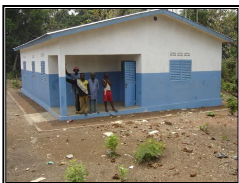
Poste de santé de Maliguiagbé