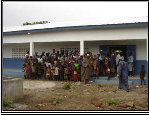
Ecole primaire rurale de Saloun Fofu (Kindia)

Cette image présente l'enthousiasme des populations de Saloun Fofu à recevoir pour la première fois leur école primaire de trois classes.