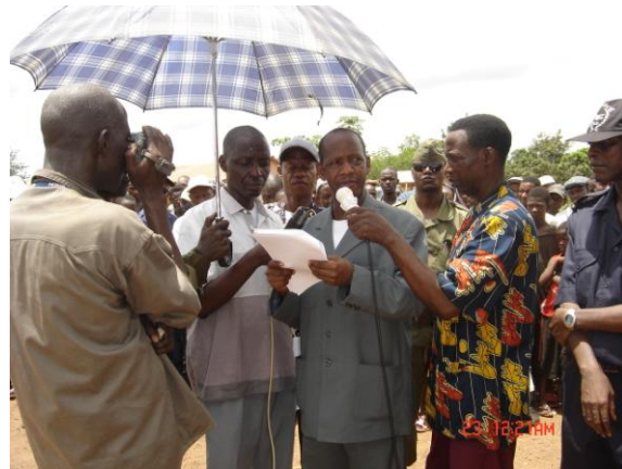
Allocution de bienvenu du Préfet de Forécariah