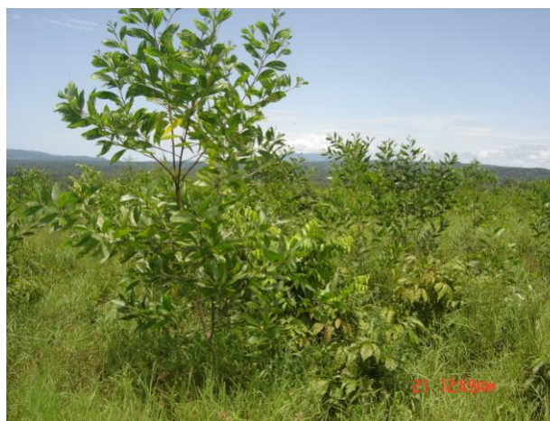
Une zone reboisée à Simbarayah (2006)

A Kindia, la superficie reboisée est de 100 hectares c'est-à-dire 100 %