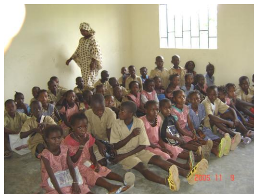
UNE SALLE DE CLASSE A MAFERENYADI (CRD FARMORIAH)