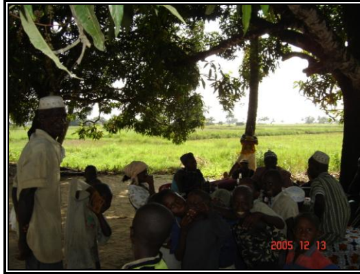
Une vue de Mabala sur les zones de Production céréalière.