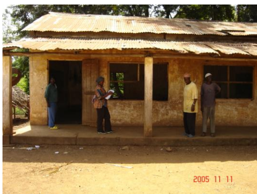
Vue de face de l'école primaire de Kolakhouré