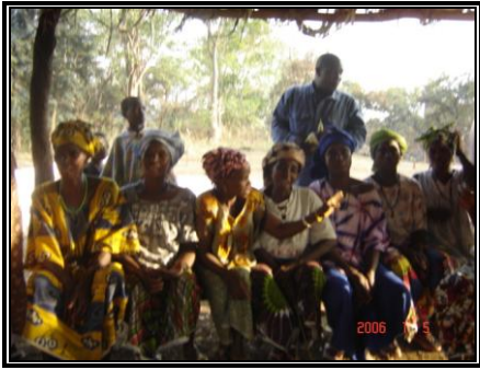
Installation du comité de gestion A Kolakhouré (Kindia)