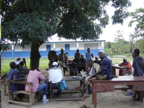
Quelques images de sensibilisation sur le terrain