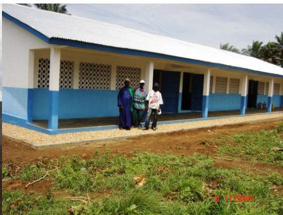
Une école de trois salles de classe