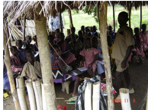
Une autre salle de classe de 28 élèves à Modia

Ces images sont largement représentatives de la situation de référence du projet. Les activités du projet ont permis d'améliorer cette situation en dotant les communautés d'infrastructures et de structures de gestion communautaires capables d'assurer la préservation des acquis.