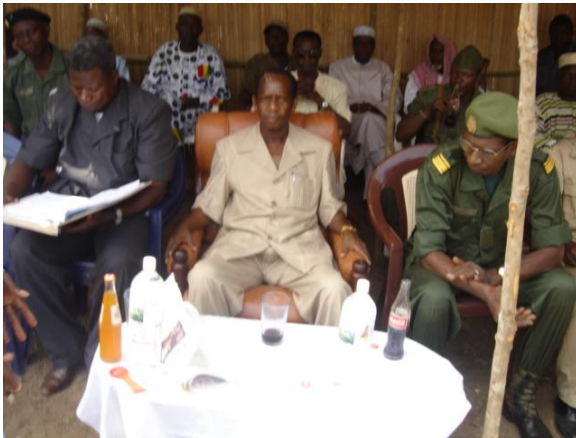
Le Préfet de Forécariah