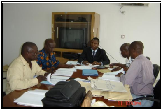
L'équipe de consultants à gauche, les deux Ingénieurs du PRCFK à droite et le rapporteur du CCBA au milieu pour l'analyse des offres