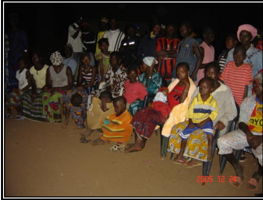
Une vue de la séance de mise en place Du comité à Mabala.