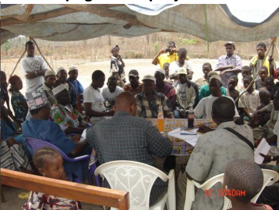
Le Coordonnateur lors des réceptions définitives des infrastructures