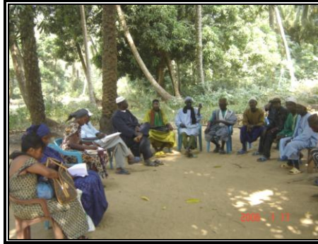
Séance de Diagnostic Participatif (DP) sur la réalisation d'une banque De céréales à Kaback