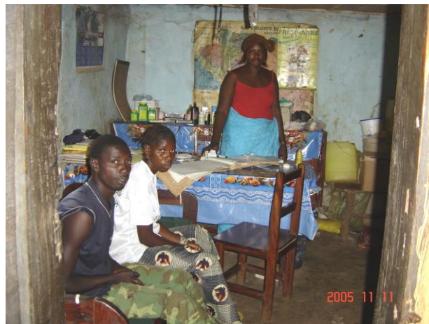
Le poste de santé de Simbarayah dans le salon de l'agent de santé

L'étape de Kindia a pris fin par une réunion de synthèse avec l'autorité Préfectorale, les services techniques préfectoraux et les autres intervenants le 05 Août 2005 sous la présidence du Secrétaire Général chargé des collectivités. Il faut noter que cette étape a été marquée par les situations particulières des infrastructures existantes à Kolakhouré et à Simbarayah comme indiquées sur les images ci-dessous :