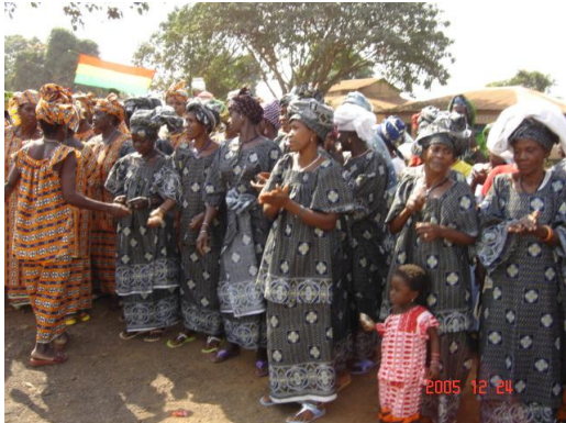
Les femmes de Simbarayah lors de cérémonie