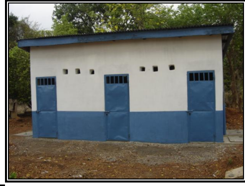
Latrines du poste de santé de Simbarayah (Kindia)

Cette image présente l'enthousiasme des populations de Saloun Fofu à recevoir pour la première fois leur école primaire de trois classes.