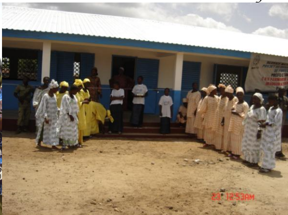
Madame la Directrice Nationale Adjointe du SENAH