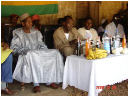
De gauche à droite, le Préfet de Forécariah, le Directeur de cabinet du Gouvernorat, le DPS de Kindia et Le Coordonnateur lors de la cérémonie