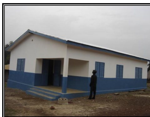
Poste de santé de Simbaraya (Kindia)