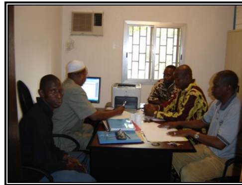
Le comité d'analyse des offres au siège du PRCFK