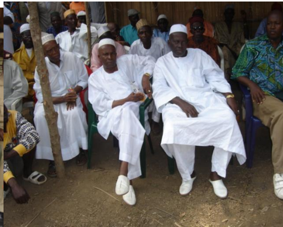
Les notables de Farmoriah