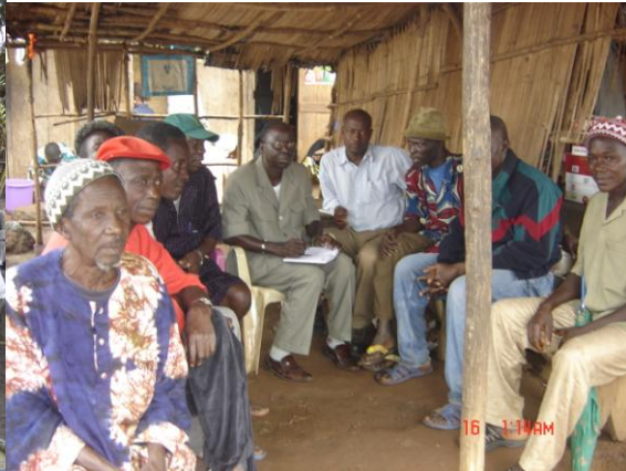
Des séances de travail de l'équipe de projet sur le terrain