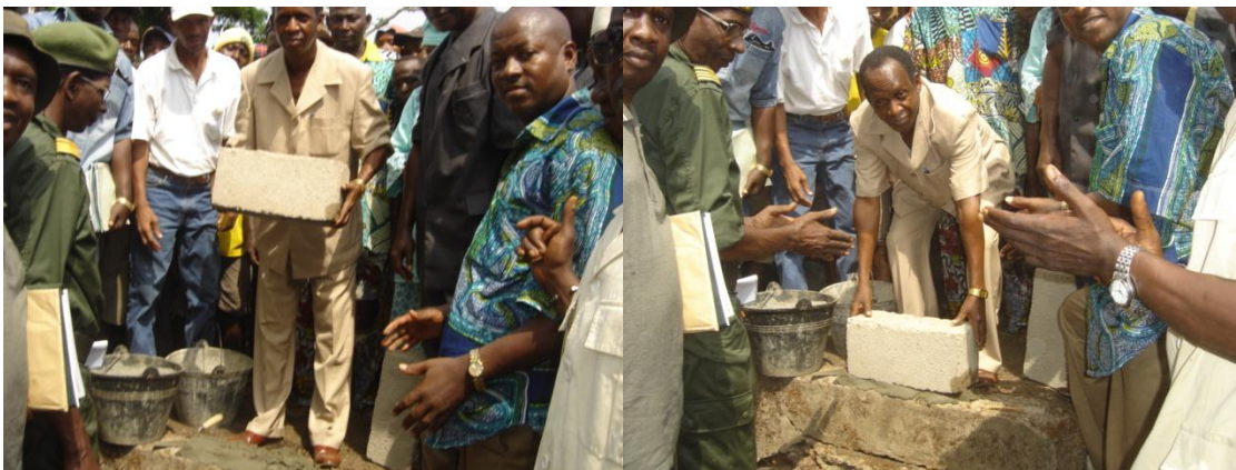
Le préfet procède à la pose de la 1 ère pierre du centre culturel