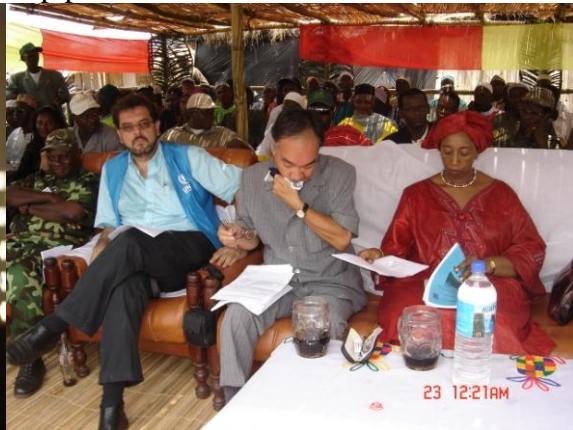
La tribune officielle installée pour la circonstance