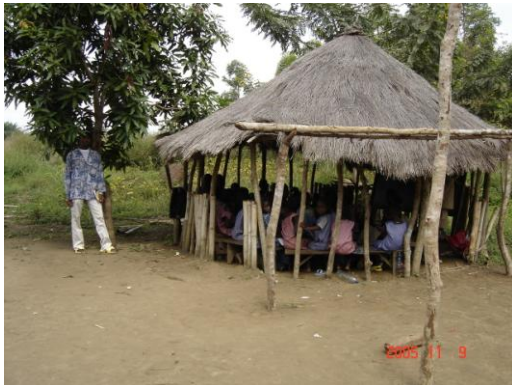
Une salle de classe à Modia

Trois salles de classe seront bientôt réalisées sur ce site de Modia par le projet. Ces trois salles de classe sont délocalisées à Tamagalidy qui ne correspond pas à la carte scolaire.