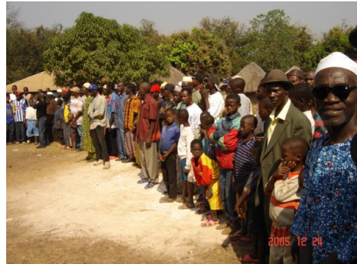
Les populations de La Simbarayah Attendent de recevoir la délégation