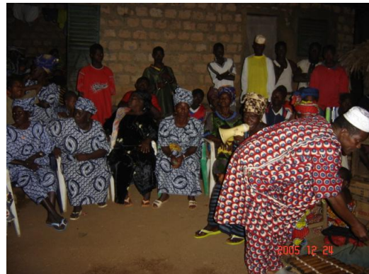
Une danse folklorique à la veille de la cérémonie