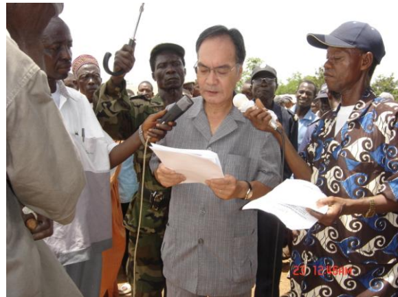
Madame le Représentant du PNUD et Mr l'ambassadeur du Japo