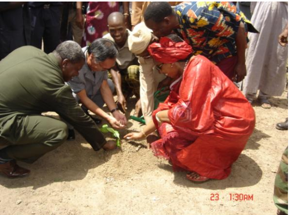
Mr l'Ambassadeur du Japon et Madame le Représentant du PNUD plantent des arbres symboliques.