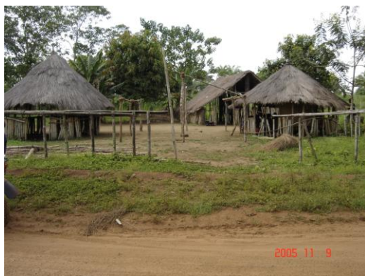
Une vue d'ensemble de l'école Primaire de Modia dans la CRD de Farmoriah

Dans la Préfecture de Forécariah, les situations suivantes ont retenu l'attention de l'équipe (voir images ci-dessous)