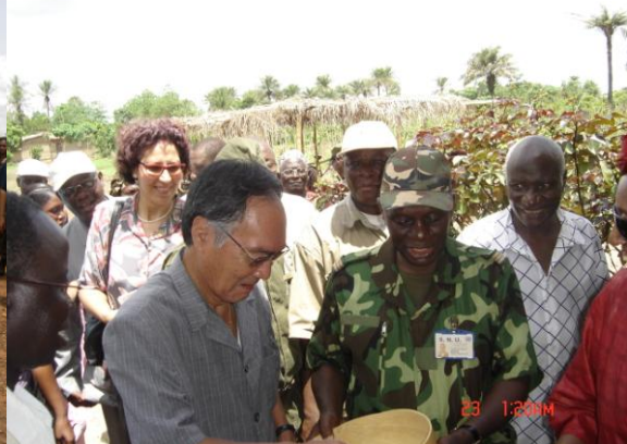
Mr L'Ambassadeur du Japon en compagnie de Madame le Représentant Résident du PNUD en Guinée, du Préfet de Forécariah et leurs principaux collaborateurs reçus en cours de route dans le