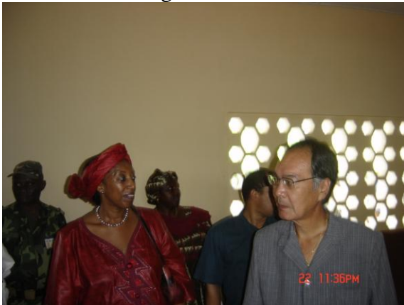
Les Hotes dans une salle de classe