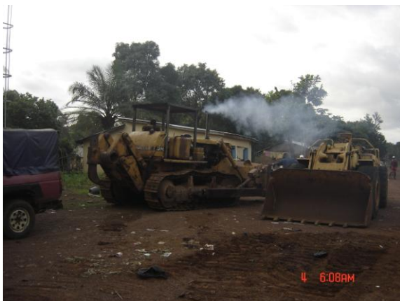
Lancement des travaux de la piste De Kondéhouré (Forécariah)