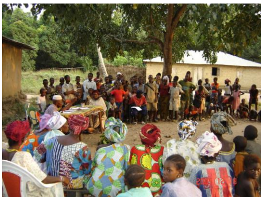
Réunion communautaire de Tonkoyah sur la Banque de céréales